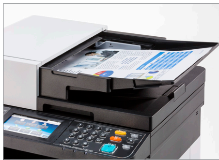
Alimentador de lectura simultánea